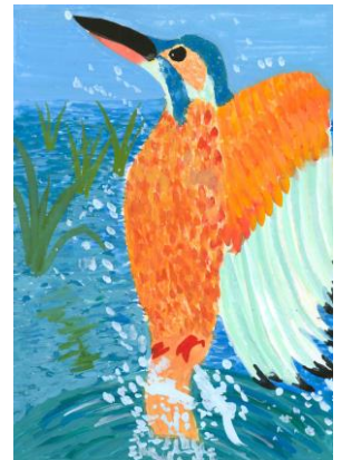
『カワセミを見たよ!!』

〜猪名川河川レンジャーからのコメント〜 川のそばには大きな草や小さな草が生えていて、きれいな猪名川にトンボがいっぱい飛んでいたんだね。川もトンボも生き生きと描かれていて、虫取り網で一生懸命トンボを追っている様子がよくわかりました。すごく楽しく、明るい絵になりましたね。楽しさが伝わってきます。