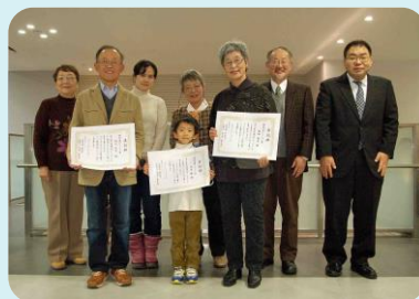
表彰式に出席していただいた入賞者のみなさんと記念撮影 平成26年12月20日 池田商工会議所にて

猪名川における環境啓発活動などに取り組んでいる大学生や子どもたちも参加する『猪名川水環境交流会』の場で、表彰式を行いました。入賞者には表彰状と副賞が授与され、入賞作品をスライドに写して紹介しました。