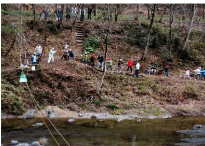
『子どもと一緒に知恵と人力でゴミ渡し』 猪名川まもり隊さん

〜猪名川河川事務所長からのコメント〜 猪名川まもり隊が一体となって活動されているのがよく表現されている作品です。