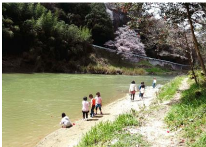
『猪名川とエドヒガンと子供達』 則久 正志さん

〜猪名川河川レンジャーからのコメント〜 おだやかな猪名川に赤いツバキの花を浮かべ遊ぶ子どもたち、そのむこうには大きなエドヒガンの桜が満開です。春の猪名川の楽しさが伝わってくるようです。岸辺でゆったり遊ぶ子供たちに焦点をあて、桜を背景に添えたのがポイントになりました。また、川を中心に画面右端で一点に収束する構図も安定感があり、画面を引き立たせました。