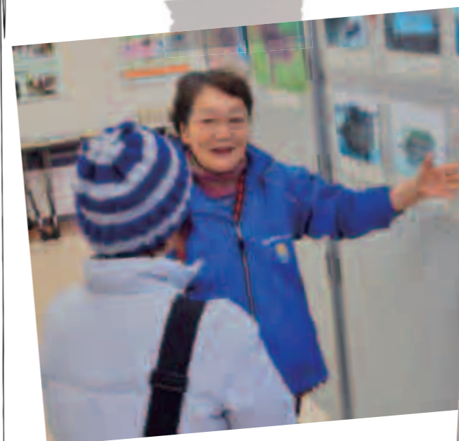
い~なの場所を説明する権原レンジャー。い~な、だけに、楽しそうです。