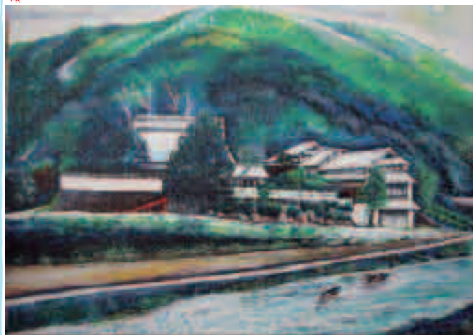
里山風景 村田はつみ 猪名川町鎌倉は萱葺きの家があり、家の中に大手門、通り門、くぐり門がある、古き素晴らしい家