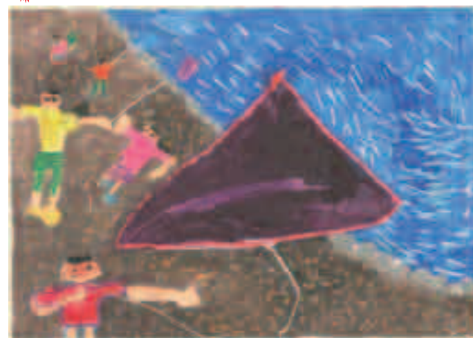
きょうりゅうの様なタコ 鈴木 航