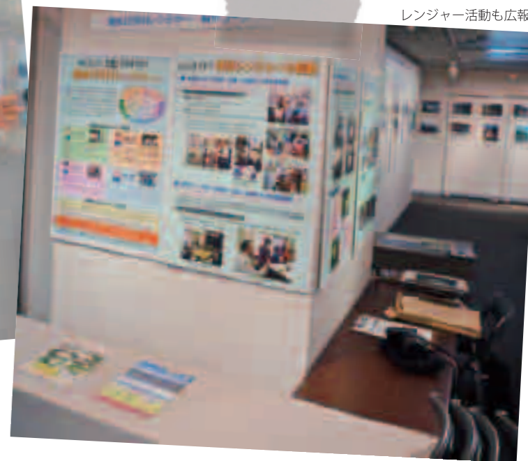
レンジャー活動も広報