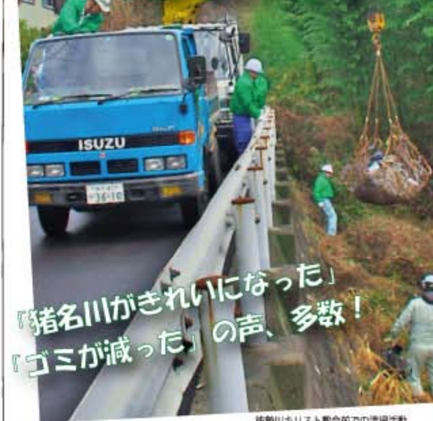
猪名川クリスト教会前での清掃活動

2月2日(土曜日)に猪名川クリーン作戦実行委員会の主催で、猪名川流域の26箇所で一斉に清掃活動を行う「第10回猪名川クリーン作戦」が開催されました。