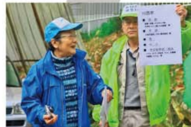
榎原レンジャー 猪名川クリスト教会前

当日は、私たち河川レンジャーと協力員も、受付や説明をお手伝いするとともに、ゴミを拾いました。実際に皆さんと一緒にゴミを拾うことで、猪名川をきれいにしたい、良い川にしたいという思いを共有できました。