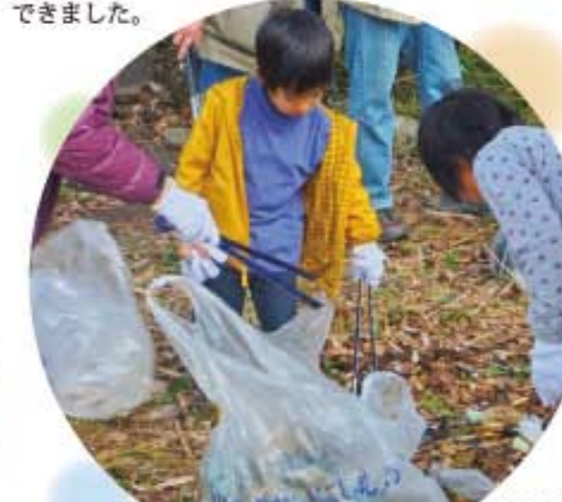
ボクも分業をお手伝い イズミヤ猪名川左岸河川で