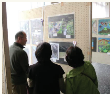
池田市役所での様子 (2014年)