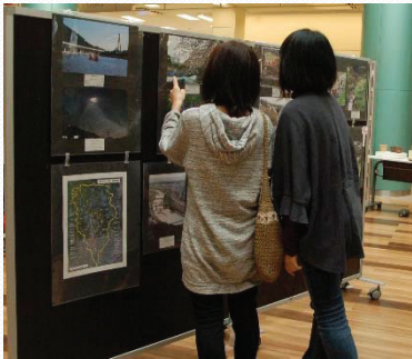
イオンモール伊丹での様子 (2014年)