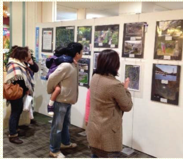
イオンモール猪名川での様子 (2014年)