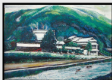
「里山風景」(村田はつみさん)