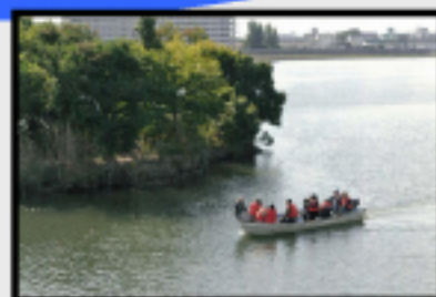
「出会いの島「豆島」」(出本真次さん)